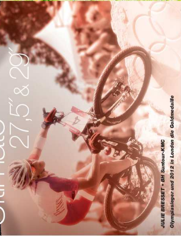
JULIE BRESSET • BH Suntour-KMC Olympiasieger und 2012 in London die Goldmedaille